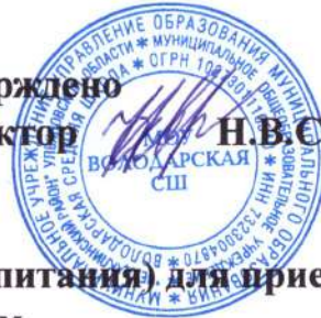
График посещения помещения (центр здорового питания) для приема пищи родительским контролем